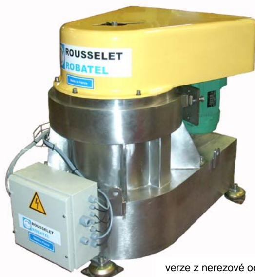
verze z nerezové oceli