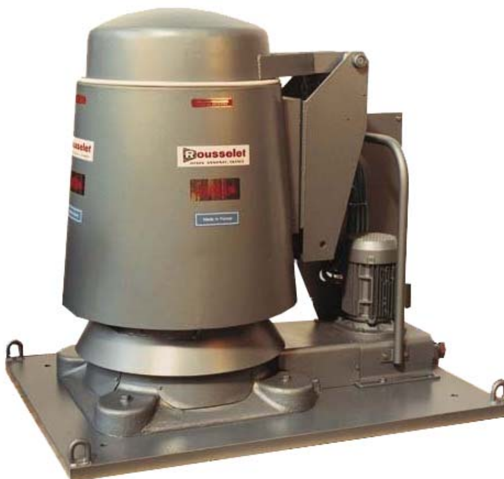
Typ RC 60 KG s automatickou manipulací bubnu

Hydro extraktor s vyjímatelným bubnem. Pro zkrácení operačního času je vysoušecí fáze zahájena okamžitě po uzavření víka. Přebytečný materiál je vyloučen spodní částí stroje.