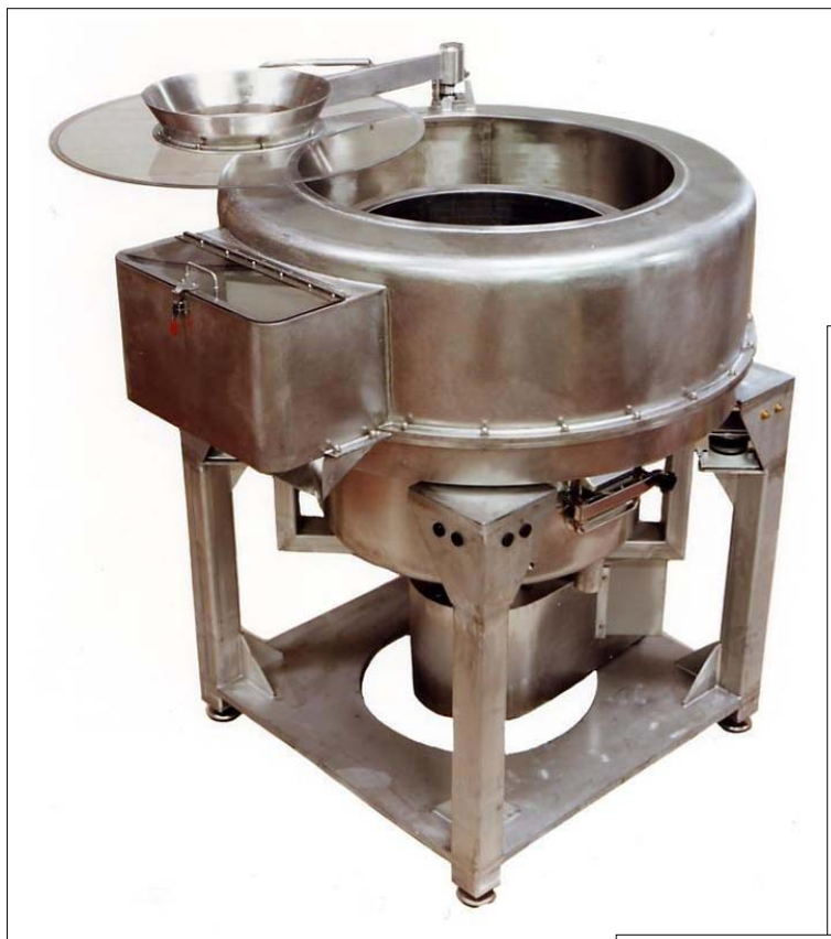
Odstředivka typ RCPC 70 Vx

Odstředivka RCPC Vx byla zkonstruována tak, aby mohla být začleněna do automatické procesní linky pro rychlé vysoušení zeleniny, salátů a ovocných produktů, bez jejich poškození