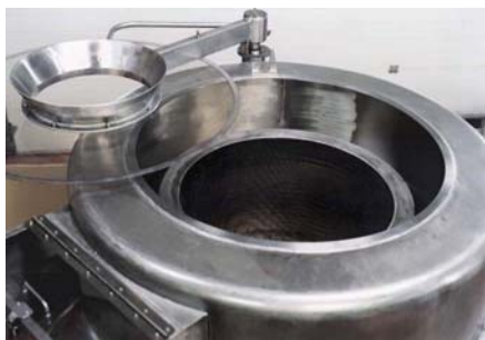
Víko na otočném čepu