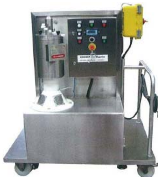
LX 124 SKID MOUNTED

Odstředivky v souladu s evropskými směrnici a standardy (a ATEX v jednotlivých zemích).